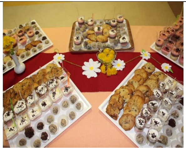
Zapila: Anemari Kapler